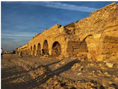
2000 Jahre alt und 6 km lang: Aquädukt in Caesarea