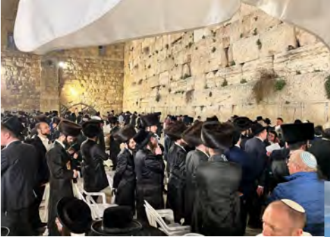
Freitagabendgebet an der Klagemauer, Jerusalem