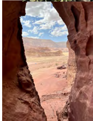
Blick von den „Säulen des Salomos“, Timnan National Park

Es war für uns eine ganz besondere Reise, die wir (mein Mann und ich mit einer kleinen Reisegruppe) nach Israel machen konnten. Entgegen den Berichten in den Medien trafen wir vor Ort auf ein entspanntes Land