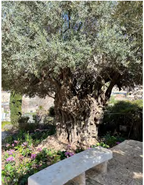
Uralter Olivenbaum im Garten Gethsemane, Jerusalem